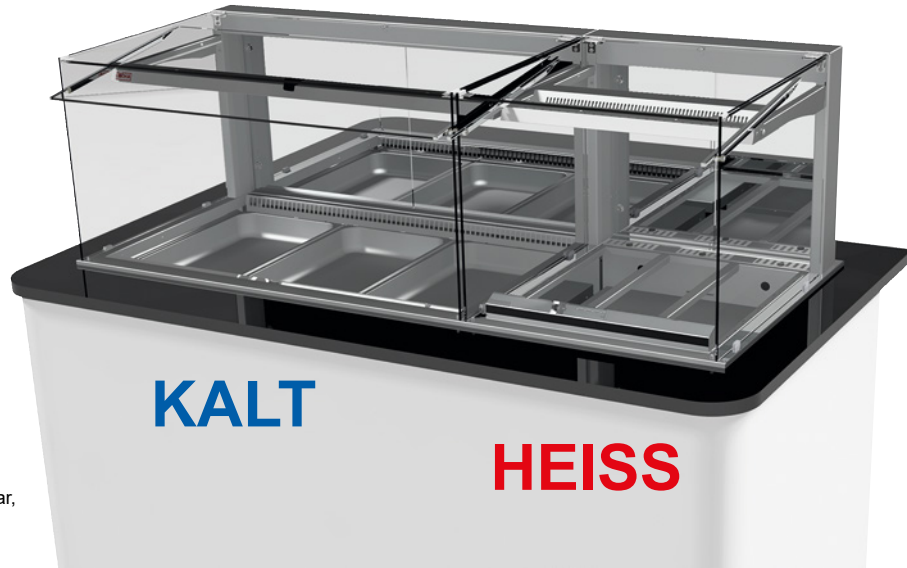
Abbildung mit Sonderzubehör.