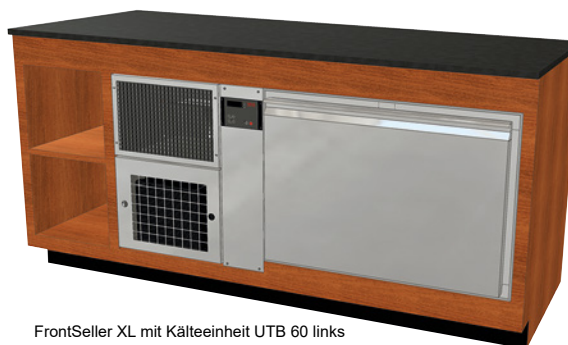
FrontSeller XL mit Kälteeinheit UTB 60 links