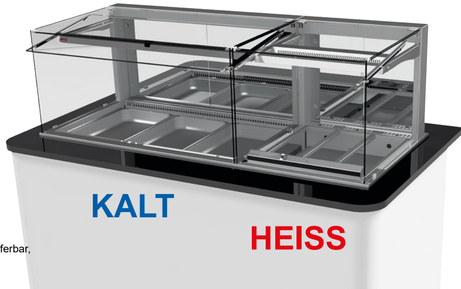
Abbildung mit Sonderzubehör.

Multifunktionale Kombination aus Warmhaltevitrine und Umluft-Kühlvitrine Als Bedienversion – oder als SB-Vitrine nutzbar