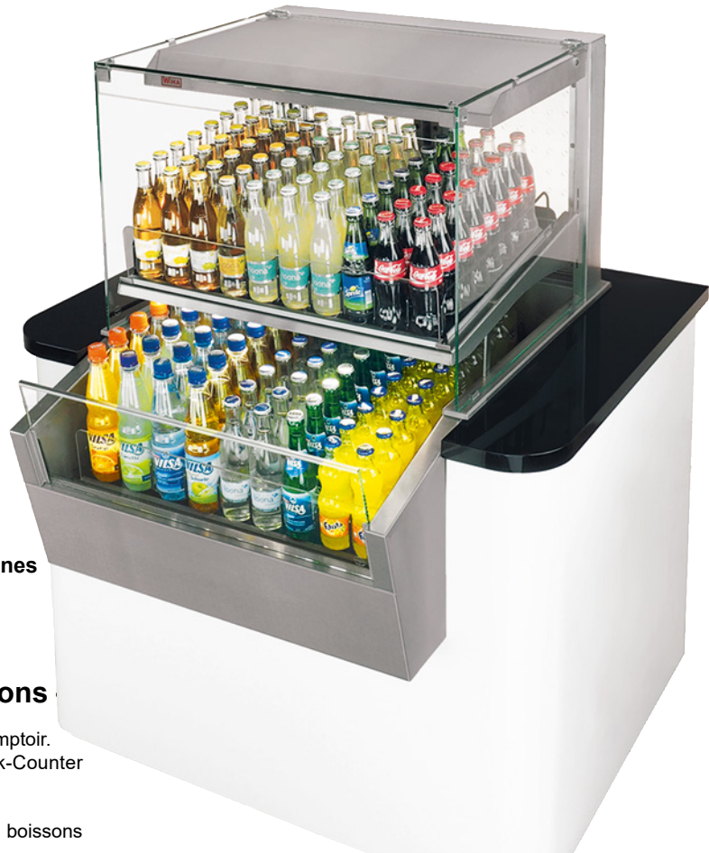
Le comptoir et les accessoires illustrés ici ne sont pas inclus dans la livraison.

Contrôle facile du niveau de stockage de la vitrine du côté service, d'où se fait aussi le remplissage. Une fois les portes battantes ouvertes, il suffit de poser les bouteilles sur le présentoir. Dès qu'un client prend une bouteille, le dispositif d'avancement remplit automatiquement la vitrine.