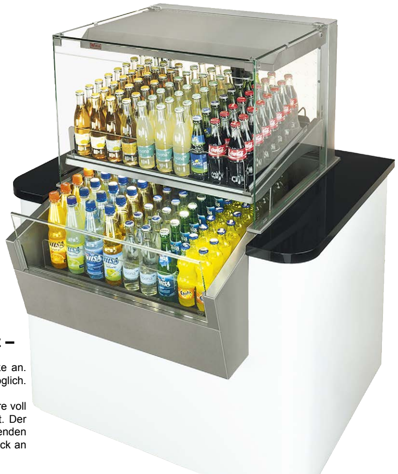
Das abgebildete Thekenmöbel und das abgebildete Zubehör gehören nicht zum Lieferumfang.