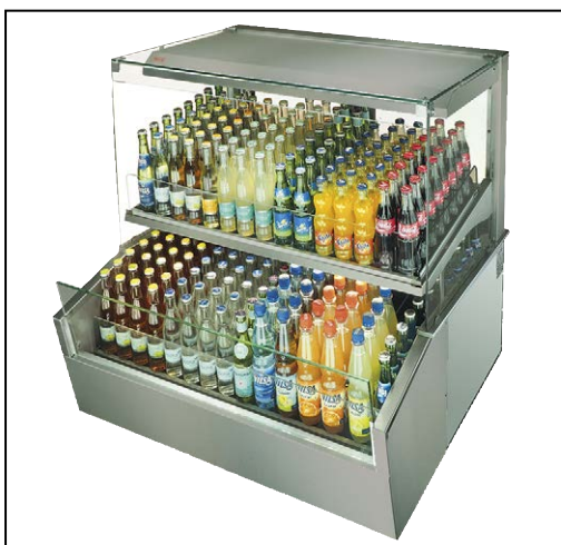
Abb.: Im Snack-Counter 520 E DISPENSER 3 können bis zu 15 Flaschenreihen nebeneinander präsentiert werden.

Von der Bedienseite ist der Füllstand der Vitrine einfach einsehbar. Das Nachfüllen erfolgt ebenfalls von der