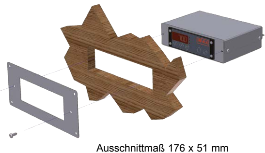
Ausschnittmaß 176 x 51 mm